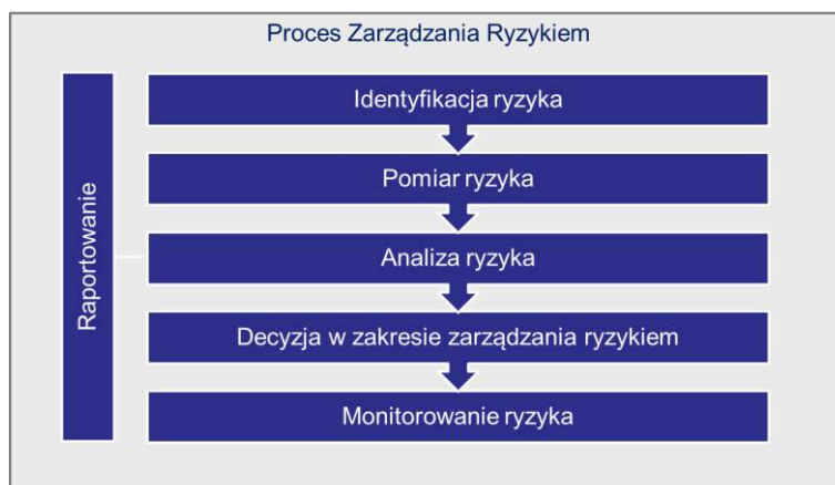
Rysunek 3. Schemat procesu zarządzania ryzykiem

Nie jest to proces całkowicie sekwencyjny, lecz cykl kontrolny, w którym występują ścieżki reagowania jak i zapobiegania. Ponadto stosuje się równolegle procesy zapewnienia jakości oraz kontroli na wszystkich etapach procesu zarządzania ryzykiem. Podstawowe procesy zarządzania ryzykiem, takie jak wyliczanie kapitałowego wymogu wypłacalności, roczna sprawozdawczość dotycząca ryzyka, czy własna ocena ryzyk i wypłacalności zostały opisane w następujących rozdziałach.